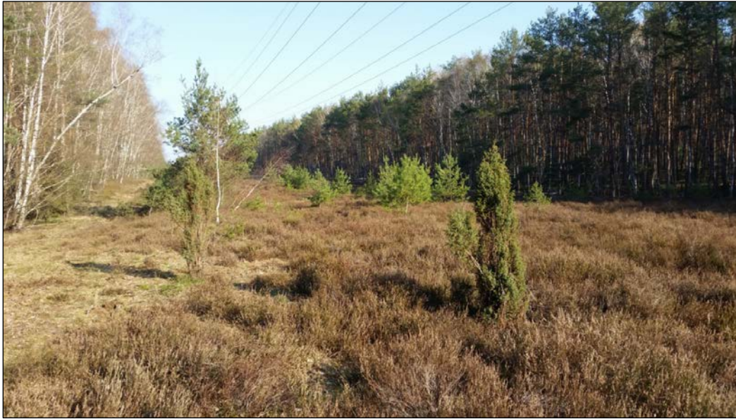
Abb. 25: Bereiche mit bereits vorhandenem Wacholder