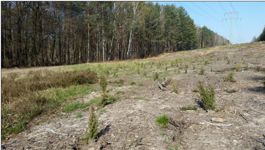
Abb. 26: Abschnitt, der 2020 mit weiteren Wacholderpflanzen ergänzt wurde