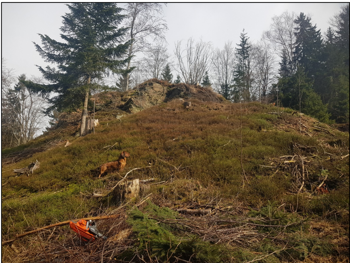
Abb. 5: Freistellung exponierter Besonnungsplätze mit dosierter Förderung zielkonformer Vorwüchse von Baumarten mit geringen Blattflächenindex (u. a. Sorbus aucuparia , Betula pendula ) im Revier Erlbach nach Abschluss der Pflegemaßnahmen (Vgl. Abb. 4)