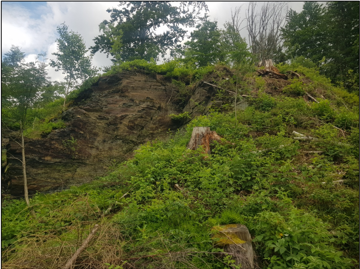
Abb. 4: Kreuzotter-Habitat im Revier Erlbach vor Beginn der Pflegemaßnahmen