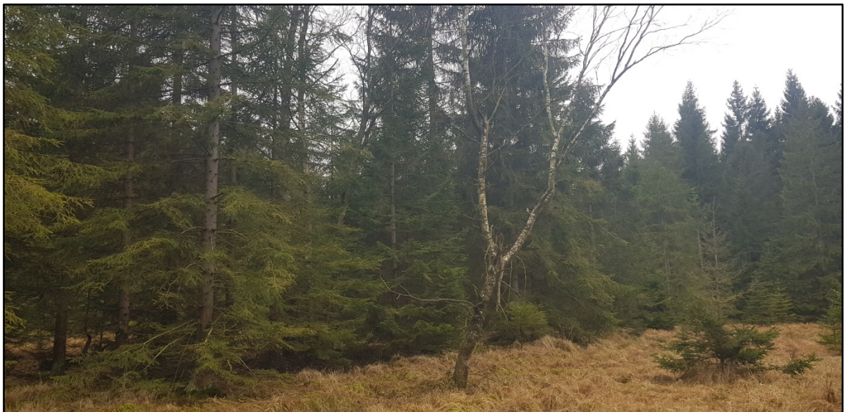
Abb. 3: Fichtengeprägter Hochmoor-Drainage-Streifen als pflegebedürftige Unterbrechung der Offenlandstruktur