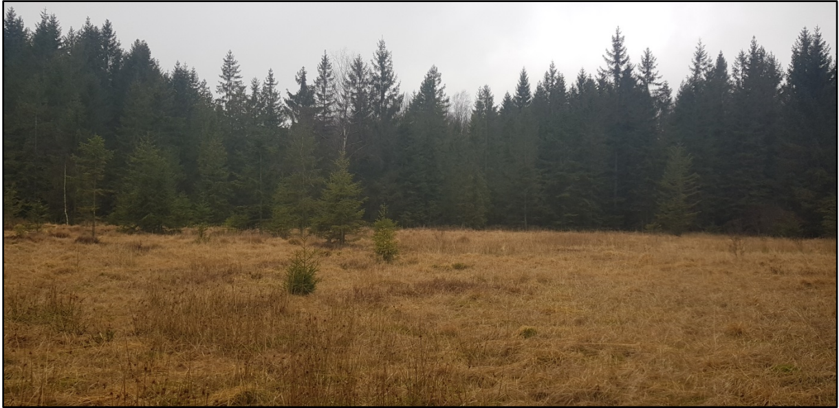
Abb. 2: Regenierbarer Hochmoorbereich (LRT) als Kreuzotter-Habitat im Revier Muldenberg