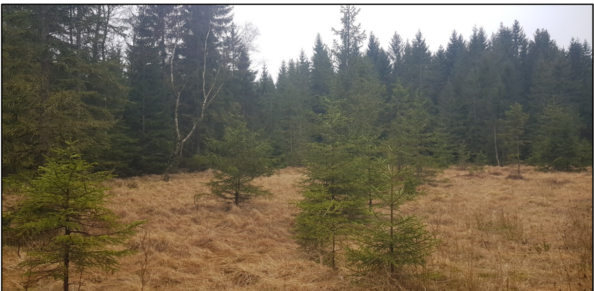
Abb. 5: sukzessionale Ausbreitung von Fichten in den Hochmoorbereich