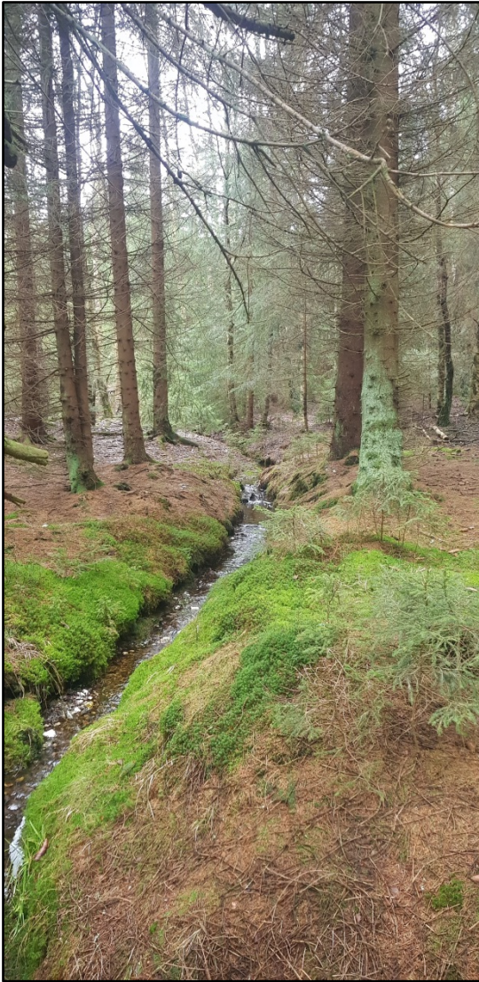
Abb. 4: Freistellung mehrerer exponierter Besonnungsplätze entlang des Fließgewässers mit dosierter Förderung zielkonformer Vorwüchse von Baumarten mit geringen Blattflächenindex (u. a. Sorbus aucuparia , Betula pendula , Betula pubescens )