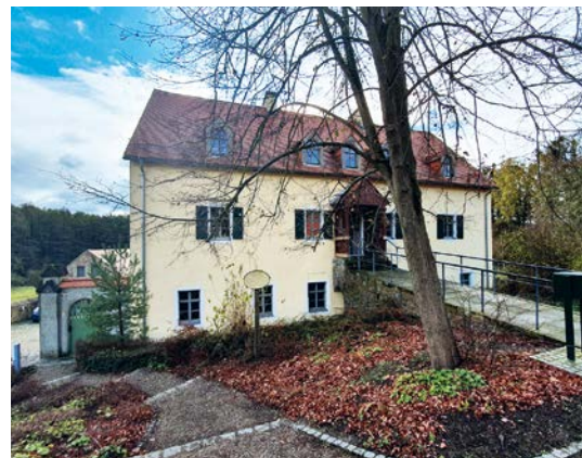
Forsthaus Kreyern; Foto: Dirk Fanko

Forstbezirksleiter: Bernd Dankert Adresse: Nesselgrundweg 4, 01109 Dresden Telefon: 0351 253080 Telefax: 0351 2530825 E-Mail: dresden.poststelle@smekul.sachsen.de Internet: www.sachsenforst.de