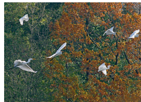
Silberreiher sind häufig zu Besuch in den Teichen RMS

Viele Vogelarten haben hier ihre Kinderstube, wie Hauben- und Zwergtaucher, Höckerschwan, Graugans, Stockente, Schnatterente, Tafelente, Reiherente, Schellente, Rohrweihe, Bläballe, Teichralle, Teichrohrsänger, Drosselrohrsänger, Beutelmehse, Rohrammer und Eisvogel. Als Nahrungsgäste besuchen uns auch Singschwan, Graureiher, Seeadler, Rotmilan und Schwarzmilan.