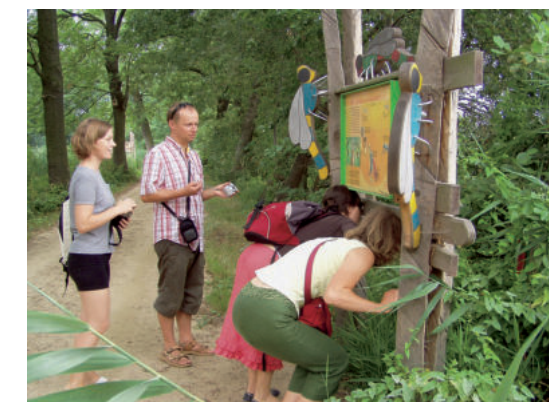
Mit Libellenaugen gesehen AM

Libellen sind mit ihren rasanten Kunstflügen die auffälligsten Insekten der Teichgruppe. Abends tanzen Mücken in großen Schwärmen über den Teichen.