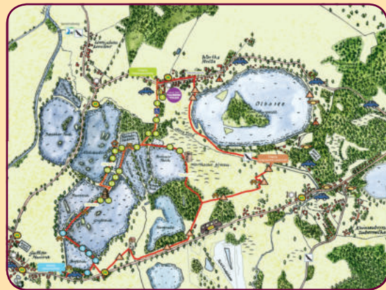
Wer entdeckt zuerst den Fledermausurm und wer hat schon den Röhrichtsteg gefunden?

In der wundervollen Heide- und Teichlandschaft gibt es zu jeder Jahreszeit etwas zu entdecken! Folgt den verschlungenen Wegen durch die Guttauer Teiche. Die Karte im Faltblatt erleichtert euch unterwegs die Suche nach den Stationen. Und natürlich kann man im Sommer baden – im Olbasee.