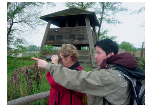
Überall gibt's was zu entdecken SB

Der Naturerlebnispfad Guttauer Teiche und Olbasee hat eine Länge von ungefähr 8,3 km – also eine knappe Tageswanderung. Wer nicht so viel Zeit hat, kann mit den einzelnen Routen auch kürzere Strecken in Angriff nehmen. Rollstuhlfahrern ist die Route »Vomerspüren der Natur« zu empfehlen. Im gesamten Bereich ist auf Betriebsfahrzeuge von Teich- und Landwirtschaft zu achten – sie haben Vorrang.