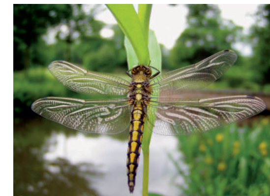
Schaut euch die Schilfhalm genau an! Dort sitzen die Libellen und sonnen sich. DW

Vor allem im Frühjahr und Sommer finden in den Guttauer Teichen regelrechte Konzertwochen statt. Das ist ein spannender Wettkampf zwischen Laub- und Wasserfröschen, Grasfröschen und Erdkröten, Wechselkröten, Knoblauchkröten und Rotbauchunken. Doch Teichmolch, Zauneidechse und Ringelnatter trauen sich nicht so recht und bleiben als Zuhörer still.