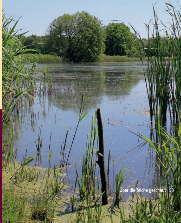
Über die Teiche geschaut SB