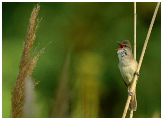
Der Drosselrohrsänger ist oft zu hören, aber selten zu sehen DW

Ihr seid mitten im zauberhaften Land der tausend Teiche, die wie Edelsteine zwischen Wäldern und Wiesen funkeln. Was denkt ihr, was euch hier erwartet? Es wird spannend – vergesst den Lärm der großen Städte! Hier könnt ihr Natur sehen, hören, riechen und fühlen. Lasst euch faszinieren vom wogenden Röhricht, vom glitzernden Wasserspiegel oder von wolkig weißen Nebelschwaden. Bestaunt im Frühjahr die Blütenteppiche der Buschwindröschen, hört die Rufe der Unkenchöre und die Konzerte ganzer Froschorchester. Erlebt im Herbst das Geschnatter hunderter Wildgänse oder nehmt einfach nur die Stimmung der Teichlandschaft mit ihren riesigen knorrigen Eichen mit!