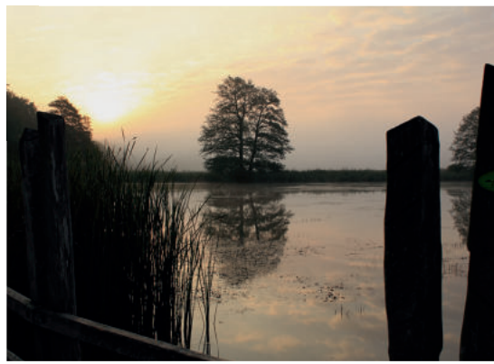
Morgenstimmung an den Teichen OH

Redaktion | Biosphärenreservatsverwaltung, Sachgebiet Öffentlichkeitsarbeit Konzept | Büro Lutra Gestaltung und Karte | Iris Brankatschk Fotos | S. Bläß (SB) – Titelfoto, D. Weis (DW), O. Harig (OH), B. Hering (BOH), A. Mrosko (AM), R. M. Schreyer (RMS) Druck | Löbnitz-Druck GmbH Auflage | 4.000, gedruckt auf FSC-zertifiziertem Papier © 2019 BR-Verwaltung, Wartha