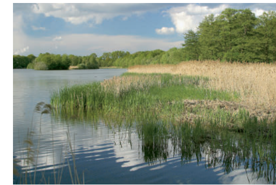
Der Schilfgürtel bietet Schutz für Brutvögel RMS

Die Wegstrecke führt von Wartha durch Feldflur und Sumpfwald in die Guttauer Teichgruppe, dort zum Vogelbeobachtungsturm (Rastplatz International) und zurück nach Wartha.