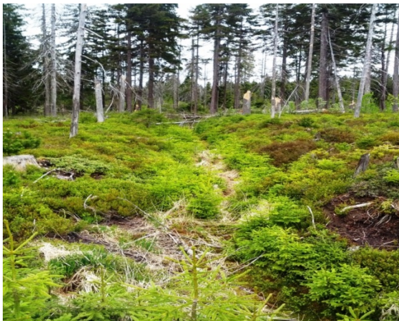
Blick auf das Eisenstraßenmoor