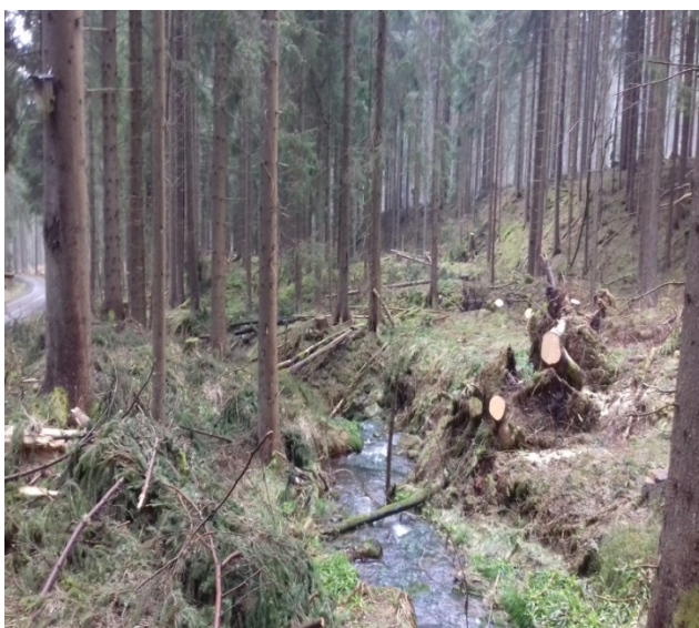
Blick ins Tal der Kleinen Bockau