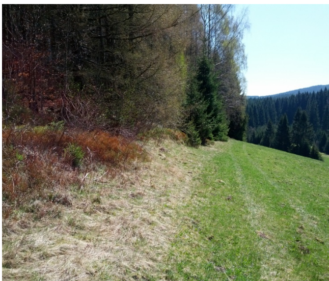
Waldrand in Abteilung 5