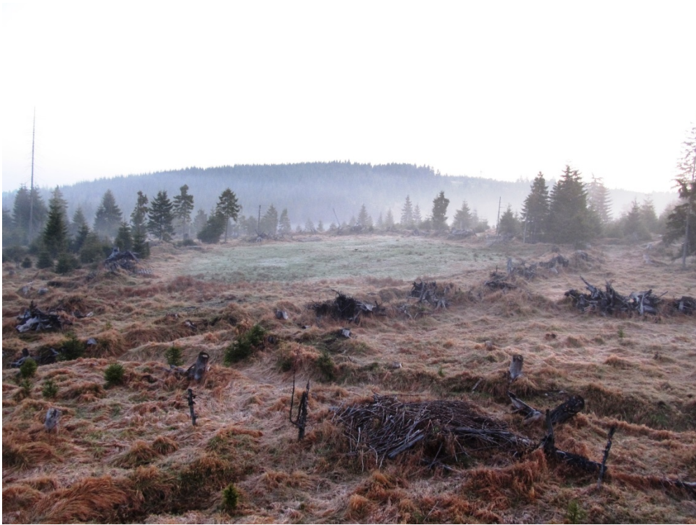
Erweiterung Balzplatz