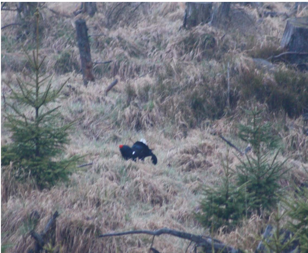
Birkhahn auf dem Balzplatz