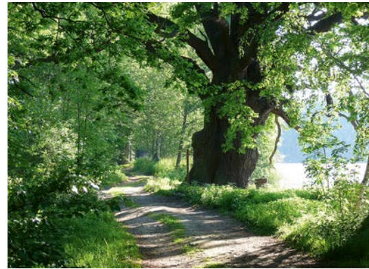
Die „Dicke Eiche“ am Ziegelteich in Niedergurig