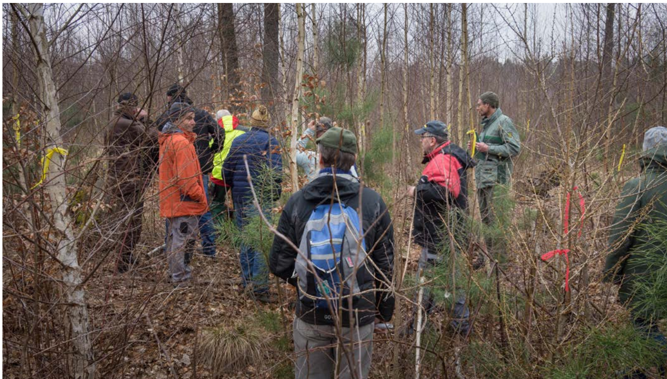
Abb. 1: Waldbesitzerwochen 2025 im Forstbezirk Oberlausitz