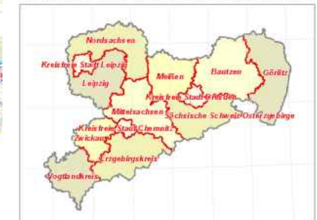
Übersicht der Forstbezirke