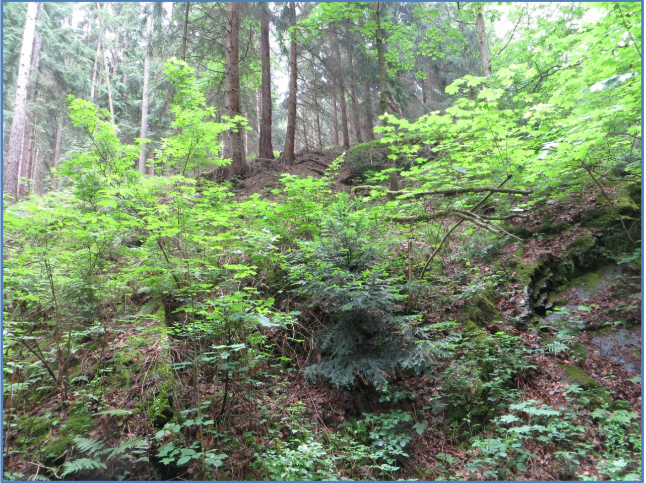
Abbildung 6: Gepflanzte Eibe neben Naturverjüngung aus Bergahorn Hainbuche und Rotbuche.