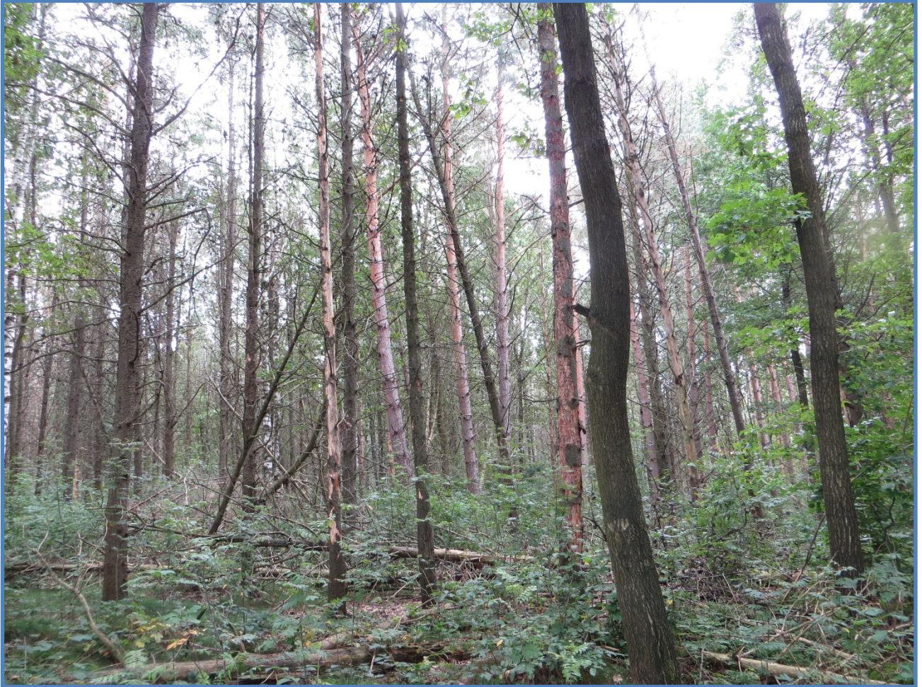
Abbildung 7: Teilweise abgestorbener Murraykiefernbestand mit Naturverjüngung.