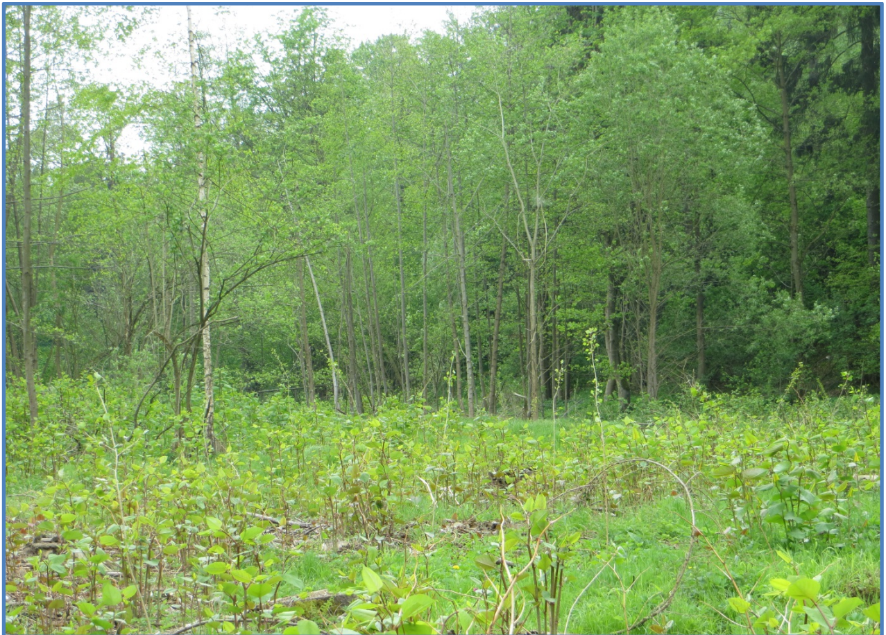
Abbildung 14: Gesamtansicht der Fläche mit Neophyten (Japanischer Flügelknöterich).