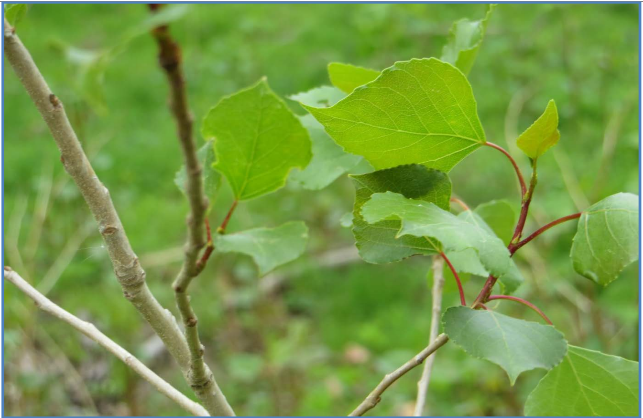
Abbildung 13: Zweig der Schwarz Pappel.