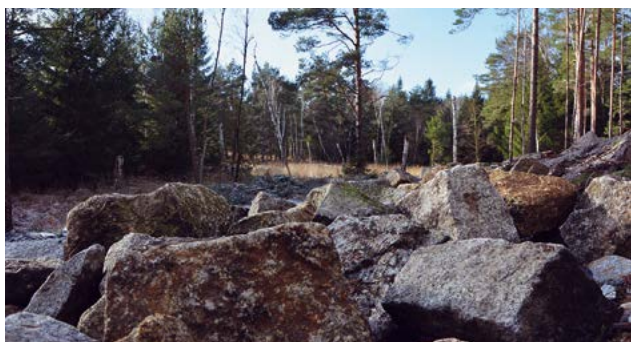
Sonnen- und Überwinterungsplatz für Reptilien

Mit der Anlage von Steinwällen wurden die Randbereiche des Moores für Reptilien attraktiver gestaltet und dienen ihnen als Sonnen-, aber auch als Überwinterungsplatz.