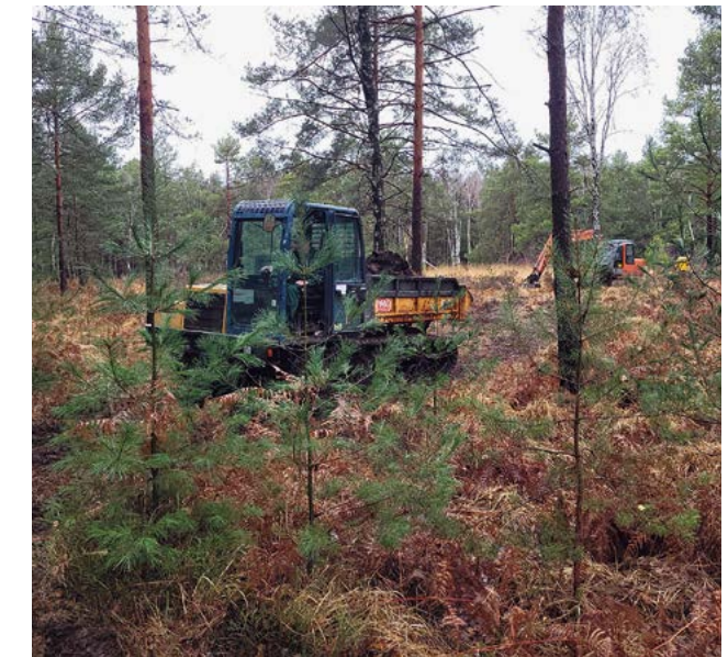
Eingesetzte Technik der Firma Landschaftsbüro Buder GmbH

Die Genehmigungs- und Ausführungsplanung zur Moorrevitalisierung erfolgte von einer Fachfirma.