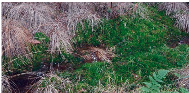
Torfmoos im Neukollmer Moor

Nachdem die Maßnahmen abgeschlossen waren, vernässten sich auf natürliche Weise auch umliegende Waldgebiete über das Projektgebiet hinaus. Das zeigt, dass sich nicht nur der Wasserhaushalt des Neukollmer Moores wieder stabilisiert, sondern auch positive Ausdehnungseffekte spürbar werden. Der Lebensraum für moortypische Flora und Fauna wurde somit verbessert.