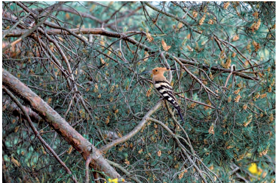
Wiedehopf bei Bärwalde

Vorrangig braucht er offene und trockene Lebensräume mit vielen Insekten, die er mit seinem gebogenen Schnabel vom Boden aufammelt. Diese findet er noch bei uns, im UNESCO-Biosphärenreservat Oberlausitzer Heide- und Teichlandschaft, in der typischen Heide, auf Streuobstwiesen, Trockenrasen und auf Flächen früherer Braunkohlentagebaue. Leider wachsen die dringend benötigten offenen Flächen stetig zu, sodass sein Lebensraum zu verschwinden droht.