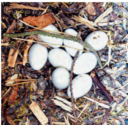
Gelege des Wiedehopfs in einer Nisthilfe; Foto: Lorenz Richter

Den Winter verbringt er in der afrikanischen Savanne und kommt lediglich im Sommer zu uns. Früher war der Wiedehopf sehr viel weiter verbreitet. Da fand er noch genügend Insektennahrung in einer Kulturlandschaft mit vielen Weidetieren wie Rindern, Schafen und Pferden vor.