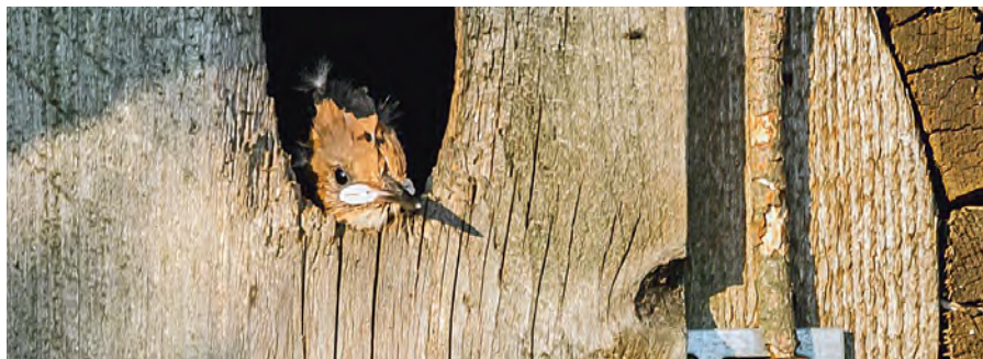
Junger Wiedehopf wartet auf Futter; Foto: Lorenz Richter

Bisher konnten über 40 Nisthilfen angeschafft und an weiteren geeigneten Orten aufgestellt