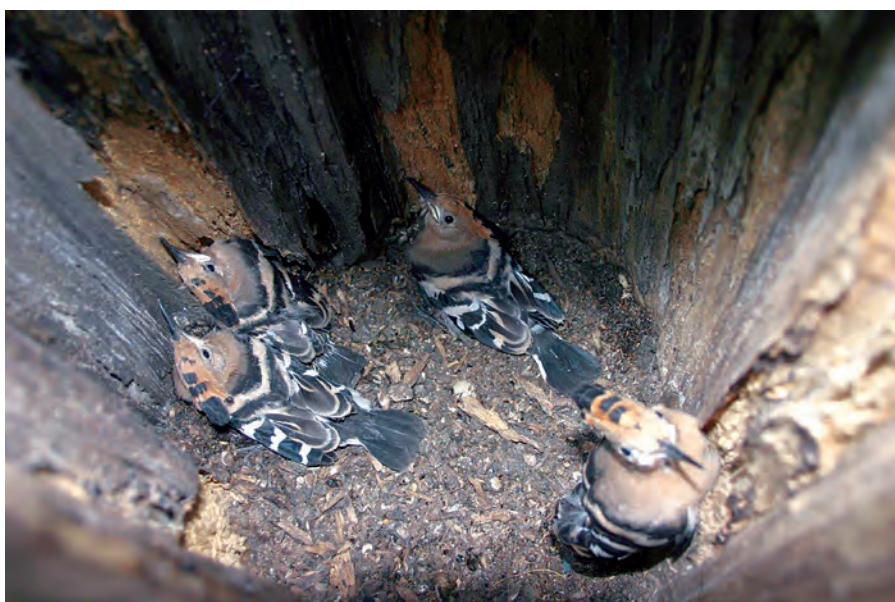
Junge Wiedehopfe in einer Nisthilfe; Foto: Lorenz Richter

werden. Außerdem werden jetzt passende trockene Wiesenflächen mit Schafen beweidet und von aufkommenden Gebüsch befreit, damit der Wiedehopf wieder freies Land zur Nahrungssuche vorfindet. Die Naturwacht der