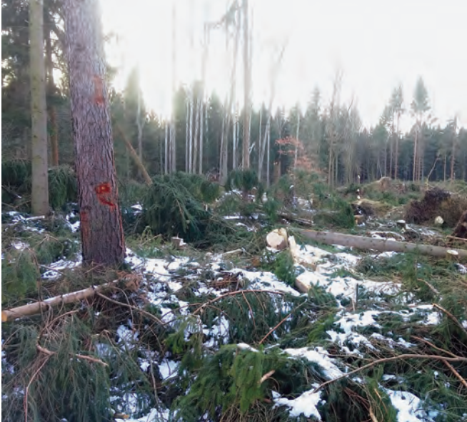
Große Schadfläche – Chance für einen Baumartenwechsel