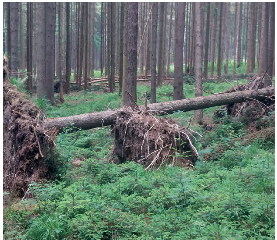
Einzelwürfe im Kleinstprivatwald