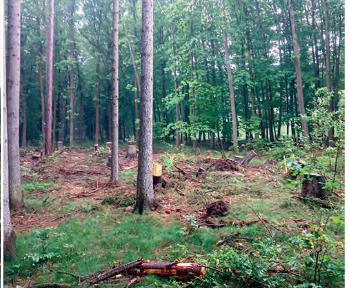
Verjüngung durch vorhandene Laubbölzer auf natürlichem Weg möglich