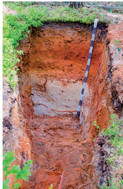
„Fuchsbraunerde“ – Bodengrube im Rahmen der Standorterkundung im Forstbezirk mit einem eher selten anzutreffenden Bodentyp; Foto: Jörg Moggert

Vor der Erhebung der Standortmerkmale im Gelände werden alle verfügbaren Daten zu den „weißen Flecken“ erfasst. Das sind hauptsächlich die Klimadaten, aber auch geologische Karten und digitale Höhenmodelle werden herangezogen.