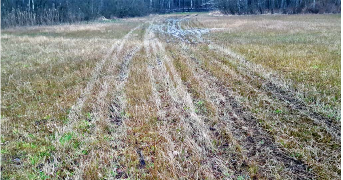
Durch häufiges Überfahren stark beeinträchtigte Wiese