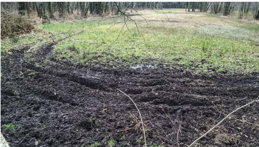
Deutlich aufgewühlter feuchter Wiesenbereich; Foto: Peter Ulbrich