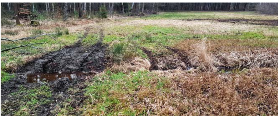
Zerfahrener ehemaliger Graben einer Wiese; Foto: Peter Ulbrich

Quads erfreuen sich zunehmender Beliebtheit. Dabei handelt es sich um vierrädrige, meist geländetaugliche Motorfahrzeuge. Der Name „Quad“ kommt aus dem lateinischen „quadri“ und steht für die vier markanten, oft grobstollig bereiften Räder des Fahrzeuges. Im englischsprachigen Raum wird die Bezeichnung „All Terrain Vehicle“ (ATV) verwendet.