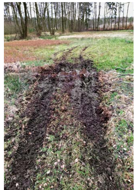
Durch häufiges Durchfahren zerstörte Nassstelle in einer Waldwiese

Akzeptanz für das Quadfahren erreicht man also nur, indem man respektvoll mit den Mitmenschen und der Umwelt umgeht. Das heißt, sich über den Verlauf einer geplanten Tour vorab genau informieren, mit eventuell