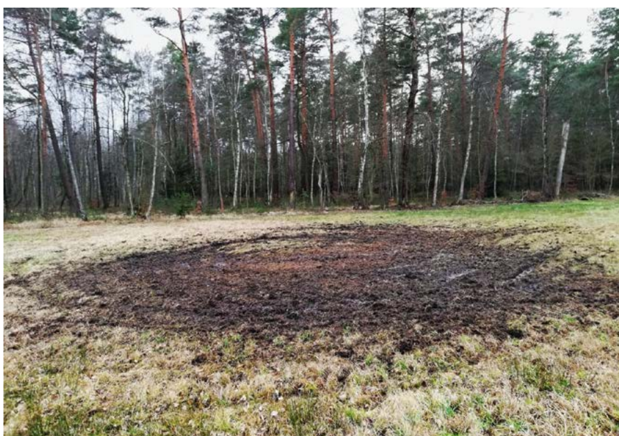
Durch Quadfahren flächig zerstörte Waldwiese (Orchideenwiese); Foto: Sandro Tenne

Betroffenen rechtzeitig abstimmen und bei Problemen immer konstruktiv im Gespräch bleiben.