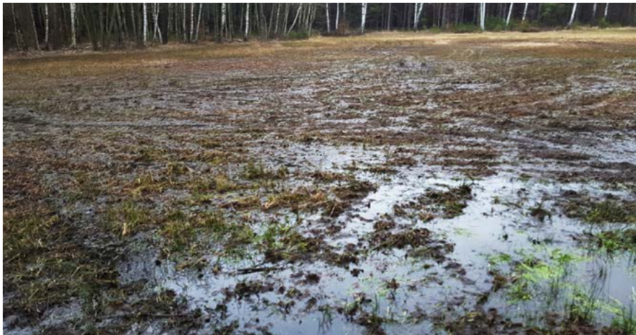
Deutliche Schäden auf der gesamten Wiese durch flächiges Befahren; Foto: Peter Ulbrich

mehr, als nach den Umständen unvermeidbar, behindert oder belästigt wird."