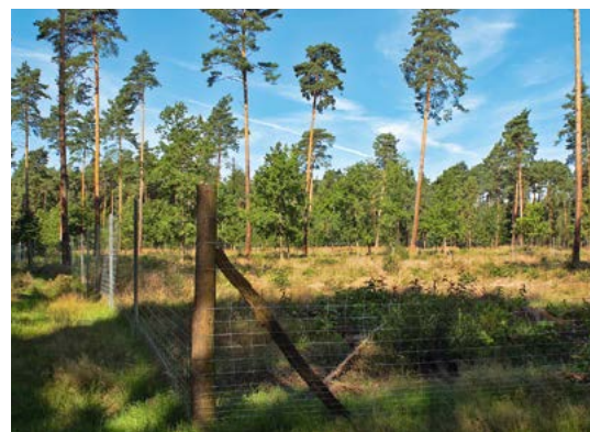
Kahlschlag im Revier Klitten; Foto: Dirk Weis

Adresse: Biosphärenreservatsverwaltung Oberlausitzer Heide- und Teichlandschaft Warthaer Dorfstraße 29, 02694 Malschwitz OT Wartha Leiter Biosphärenreservat: Torsten Roch Telefon: 035932 365-0 Telefax: 035932 365-50 E-Mail: broht.poststelle@smul.sachsen.de Referatsleiter Betrieb/ Dienstleistung: Jan Prignitz Telefon: 035932 36522 E-Mail: Jan.Prignitz@smul.sachsen.de Sprechzeiten der Revierförster: Do 16 –18 Uhr