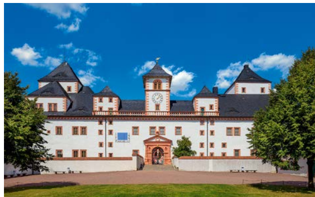
Blick auf das Schloss Augustusburg von Süden; Foto: Rainer Weisflog

Forstbezirksleiter: Bernd Ranft Adresse: Am Landratsamt 3 Haus 5, 09648 Mittweida Telefon: 03727 956601 Telefax: 03727 956609 E-Mail: chemnitz.poststelle@smul.sachsen.de Internet: www.sachsenforst.de