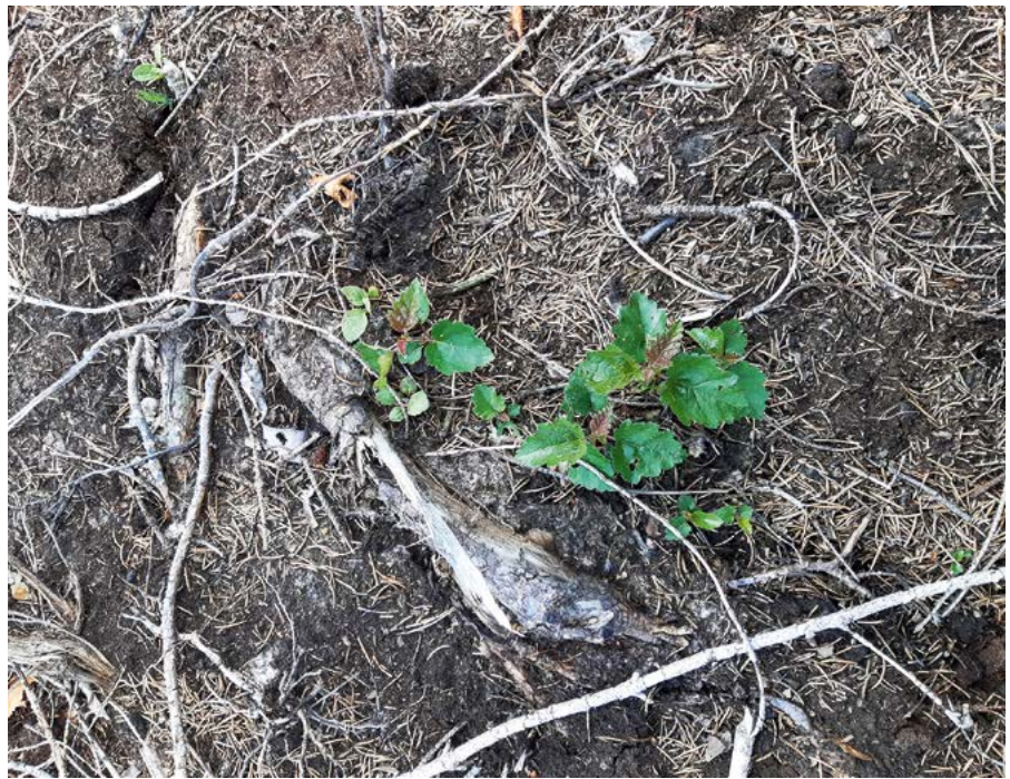
Birken-Naturverjüngung auf einer Kahlfeldfläche; Foto: Maria Adner

Vor jeder Entscheidung zur Wiederbewaldung sollten zunächst der aktuelle Zustand der Fläche, der finanzielle Rahmen und der gewünschte Zielzustand durch den Waldbesitzer analysiert werden. Neben bereits vorhandener Vegetation (natürlich verjüngte Waldbäume und andere Vegetation) sollten auch angrenzende Bestände und deren Potenzial der natürlichen Verjüngung in die