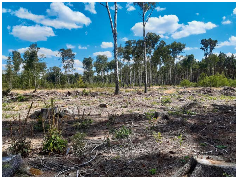
Geräumte Kahlfläche nach einem Sturmereignis

Viele große und kleine Freiflächen müssen nun wiederbewaldet werden, um die verschiedenen Funktionen des Waldes, die Nutz-, die Schutz- und die Erholungsfunktion, zu erhalten und den Bestimmungen des Sächsischen Waldgesetzes nachzukommen. Ab einer Größe von 1,5 ha hat jeder Waldbesitzer gemäß § 20 SächsWaldG die besondere Verpflichtung, kahlgeschlagene oder stark verlichtete Waldflächen innerhalb von drei Jahren wieder in eine ordnungsgemäße Bestockung zu bringen. Dies kann sowohl über Naturverjüngung als auch durch eine Pflanzung realisiert werden. Doch auch auf