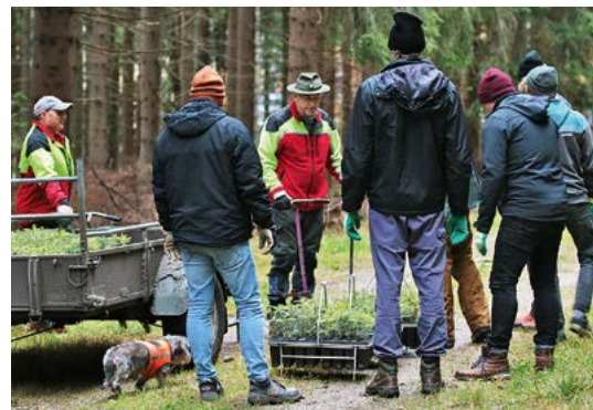
Waldbesitzer werden von einem Förster geschult