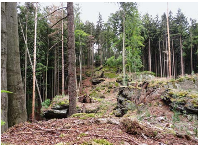
Freigestellter Felsen am Ochsenkopf

Um Totholz in unseren Wäldern anzureichern, wurde auf die Industrielholzaufbereitung verzichtet und Käferbäume nach der Entrindung im Wald belassen. Buchenkronen bleiben generell liegen. Totholz erzeugt eine günstige Humussituation, die als Wasserspeicher dient und Lebensraum für unzählige Pilze und Insekten ist. Mit diesen verschiedenen kostengünstigen Maßnahmen kann sehr viel für den Naturschutz im Wald erreicht werden. Oft können Naturschutz und forstwirtschaftlicher Nutzen auch in einem Schritt vereint werden, z.B. bei der Entnahme von Fichten zur Freistellung von Felskuppen und Wegesrändern. Durch solche Beispiele kann der Bevölkerung verdeutlicht werden, dass Nutzen auch Schützen bedeutet.