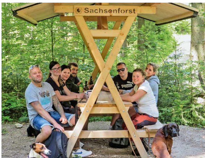
Eine Sitzgruppe an der Talsperre Sosa lädt zum Verweilen ein; Foto: Michael Pfalz

Zum Gelingen solcher Vorhaben tragen Kooperationen mit den Gemeinden, Vereinen und Unternehmen bei. Am Lehrpfad um die Talsperre Sosa hat es in diesem Sommer sehr gut funktioniert. In der Nähe des großen Talsperren-Parkplatzes hat der Köhlerverein zusammen mit der Gemeinde Sosa eine Erlebnisköhlerei aufgebaut, die am Wochenende für die Besucher offen steht. Es gibt hier einen Imbiss und Sanitäranlagen. Durch alle Beteiligten konnte so ein Naherholungs-ort geschaffen werden, der sich sehen lassen kann. Für die Zukunft bleibt zu hoffen, dass viele Besucher in den Wald zum Energietanken kommen und schöne Erinnerungen mit nach Hause nehmen.