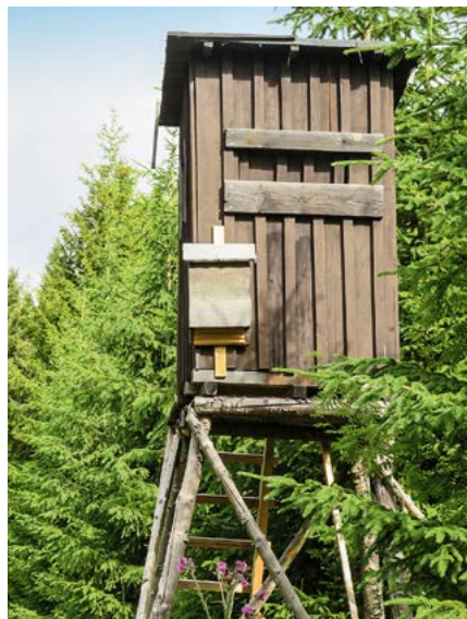
Fledermauskasten an einem Hochsitz