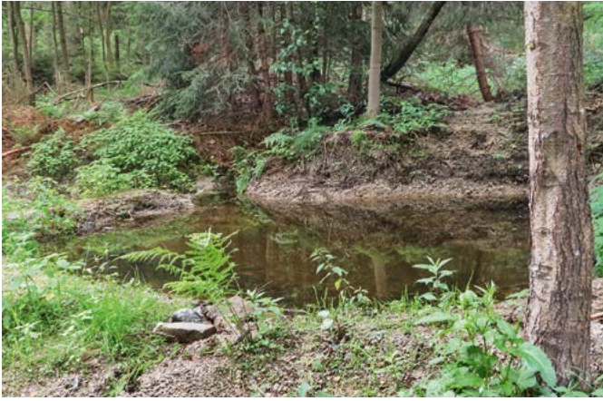
Laichgewässer im Revier Eibenstock; Foto Michael Pfalz