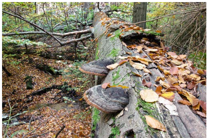
Umgebrochene Buche im Naturschutzgebiet „Am Riedert“; Foto: Stephan Schusser