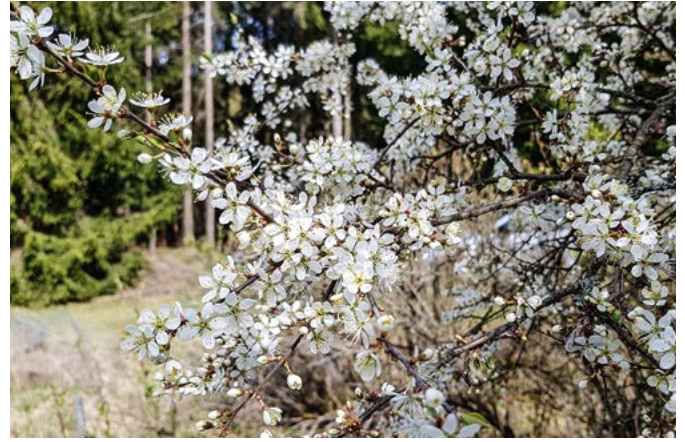
Blühender Schlehdorn

ten und Früchten erzielt werden. Das verwendete wurzelnackte Pflanzenmaterial stammte überwiegend aus regionalen Baumschulen, z. B. der betriebseigenen Forstbaumschule Heinzebank. Erste Anwuchserfolge konnten die Revierleiter bereits verzeichnen.