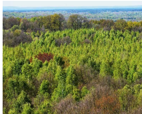
Blick vom Haselbergturm; Foto: Dirk Synatzschke

■ Besucher pro Jahr: ca. 15.000 ■ unterhaltene Wander-/ Radwege: 85 km ■ Gesamtwaldfläche: 10.309 ha ■ Staatswald (Freistaat): 9.355 ha ■ Staatswald (Bund): 846 ha ■ Körperschaftswald: 1 ha ■ Kirchenwald: 8 ha ■ Privatwald: 97 ha ■ Treuhandrestwald: 2 ha