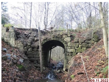
Rundbogenbrücke an der Alten Böhmi-schen Glasstraße