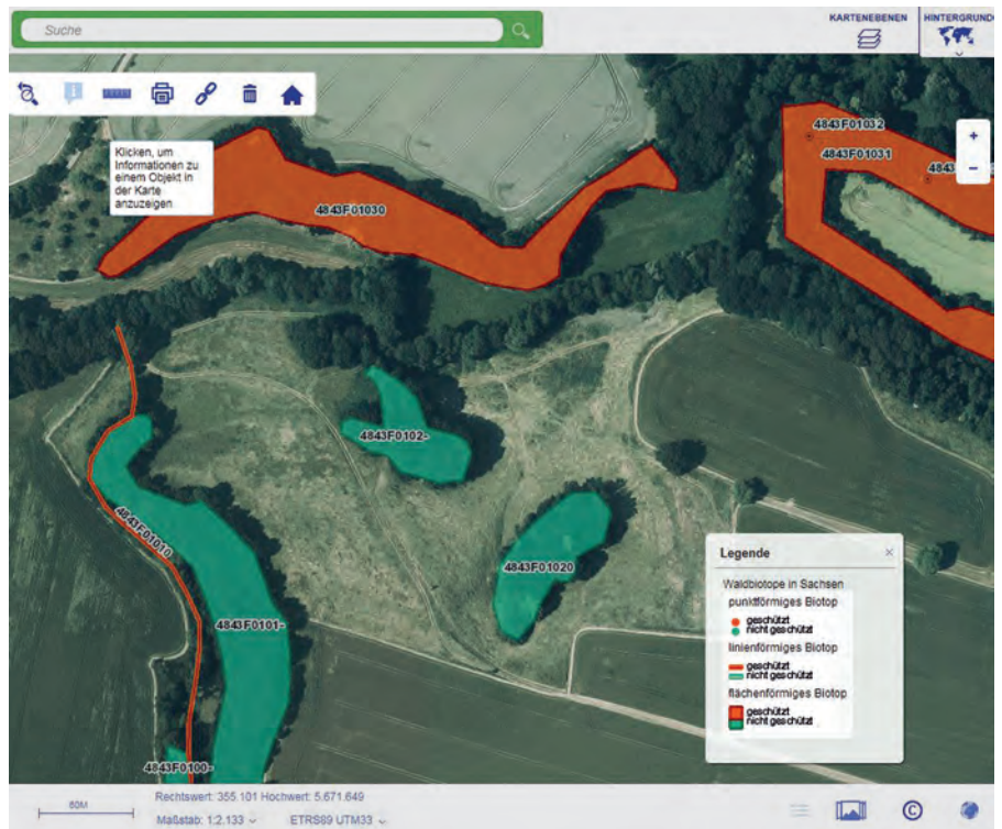
Abb. 1: Kartenausschnitt mit Luftbild

Die hier veröffentlichten Waldbiotopdaten sind das Ergebnis der Waldbiotopkartierung (WBK), die durch Sachsenforst durchgeführt wird. Die Aktualisierung der Waldbiotope ist eine fortlaufende Aufgabe. Neue Ergebnisse der Kartierung werden jährlich in den Onlinedienst eingestellt. Sachsenforst, als Daten erhebende und haltende Stelle, erfüllt somit gemäß Sächsischem Umweltinformationsgesetz die Pflicht, Umweltinformationen öffentlich zugänglich zu machen. Personenbezogene Daten der Flächeneigentümer unterliegen dem Datenschutz und sind nicht einsehbar. Über die Seite zur Waldbiotopkartierung ( http://www.forsten.sachsen.de/wald/212.htm ) gelangt man zu allgemeinen Informationen zu Biotopen und zur Kartierung sowie zum Kartenviewer selbst. Für die Einführung in den Kartenviewer gibt es zudem ein kurzes Video. Dort werden die Nutzungsmöglichkeiten und Funktionen für die Anwendung leicht verständlich erklärt. Über einen Link zur Online-Hilfe des Geoportals Sachsenatlas finden sich detailliertere Erläuterungen zur Nutzung.