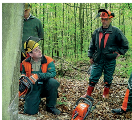
Motorkettensägens Schulung im Wald