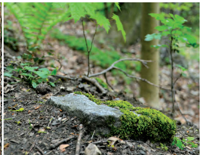
Grenzsteine im Wald – nicht immer so gut erkennbar wie im linken Bild, oft überwachsen oder ganz verschwunden