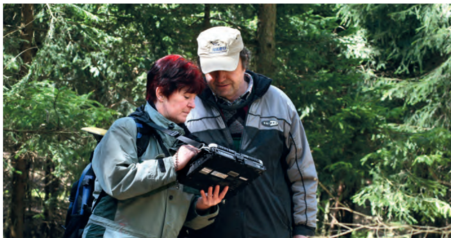
Eine Form der Beratung ist die Unterstützung beim Auffinden der Besitzgrenzen

Warum nicht mit einem GPS-Gerät nach dem vermeintlichen Punkt für den Grenzstein oder gleich nach einem Grenzverlauf suchen? Heutzutage sind viele GPS-Empfänger in vielen Anwendungen handelsüblich (Geocaching, Smartphone, Navigationsgeräte). Diese Geräte ersetzen selbstverständlich keine Vermessungsgeräte, wie sie zum Einmessen neuer Grenzen erforderlich sind. Mit diesen Geräten ist leider eine systemimmanente Ungenauigkeit verbunden. Für einen guten Empfang benötigen GPS-Empfänger „freie Bahn“ und genügend „Sender“! Mit den Sendern variiert es innerhalb einer Zeitspanne erheblich, je